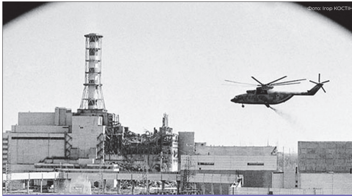
На фото зображено гелікоптер Мі-26, який здійснює дезактивацію території або моніторинг радіаційного стану над зруйнованим реактором

Від колосального внутрішнього тиску обвалилося шатрове перекриття реакторного відділення, а також покрівля машинного залу, зруйнувавши інфраструктуру блоку. Активна зона реактора