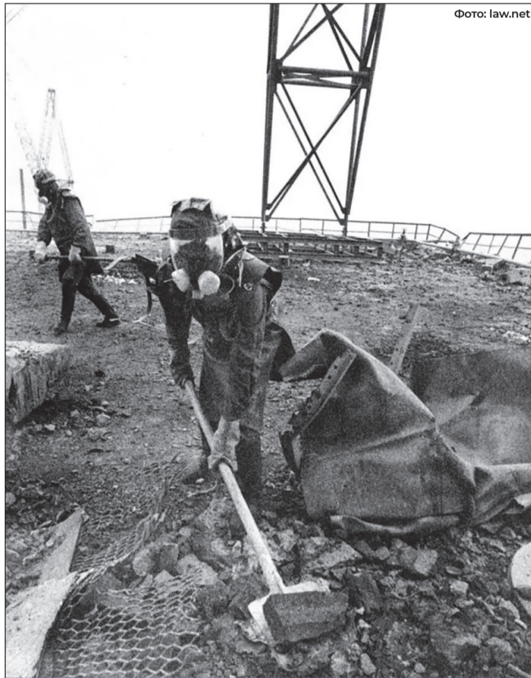
Солдати строкової служби в ненадійних захисних костюмах зачищають дах третього енергоблока

У різних приміщеннях четвертого блоку і на даху машинного залу виникло понад 30 пожеж, спричинених викидом розжареного графіту та горінням мастил. Тож, пер-