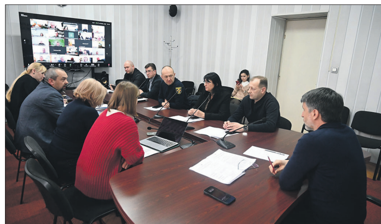
Рішення щодо призупинення або відновлення роботи дитсадків прийматимуть

«Саме тому члени регіональної комісії з питань ТЕБ та НС прийняли рішення із 25 лютого посилити проти епідемічні заходи у закладах загальної середньої освіти краю на 11 днів – перевести учнів на дистанційну форму навчання».