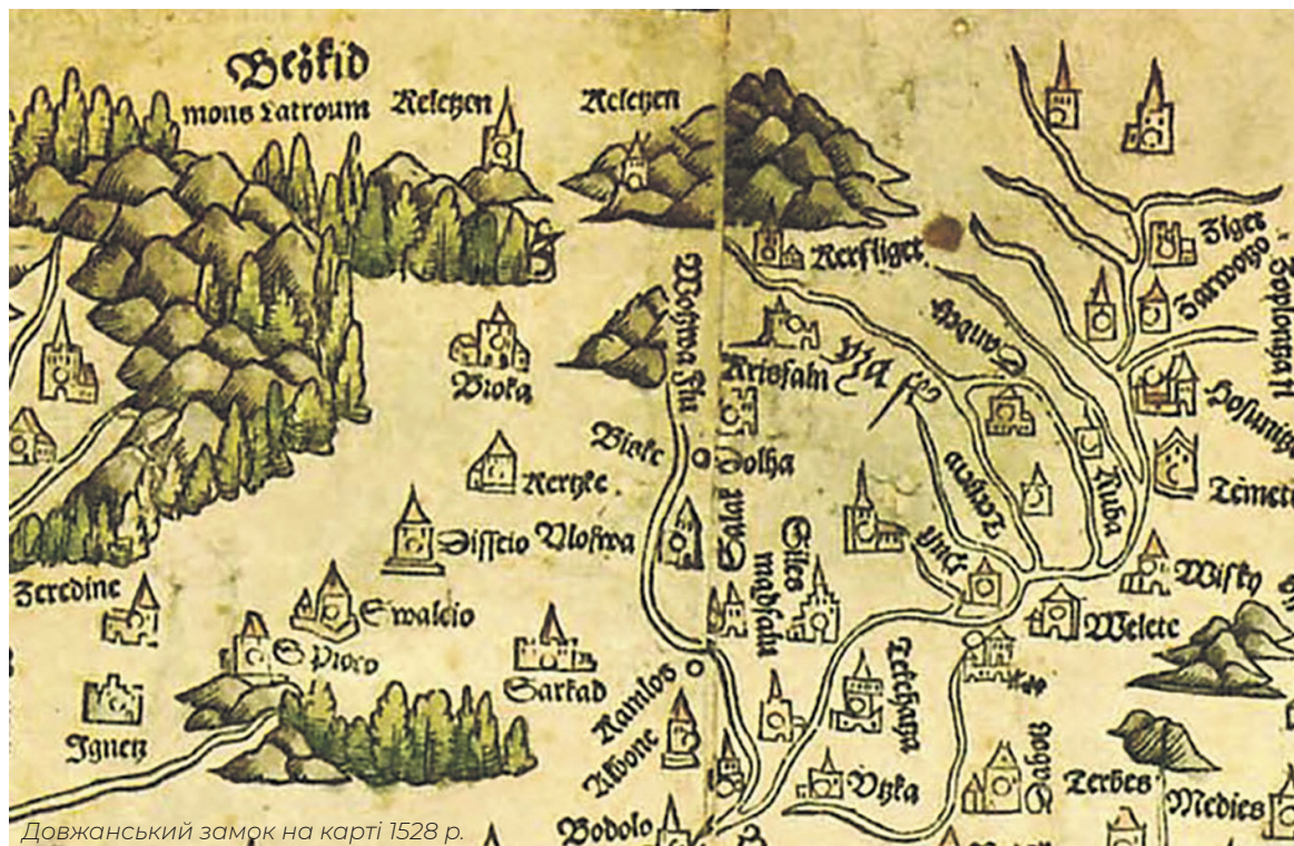
Довжанський замок на карті 1528 р.

Граф Йозеф Телекі де Сейк (József Teleki de Szék) (1738–1796) – власник земель у верхів'ях Боржавської долини, так званої Довжанської домонії. Був продовжувачем справи свого батька – Ласло Телекі , який заснував ряд мануфактур в селі Лисичево та Довге, а також розбудував довжанський палац-фортецю.