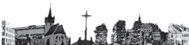
Засновник – ТОВ «Редакція газети «Вісник Хустщини»

ПО ВЕРТИКАЛІ: 1. Біда. 2. Тесленко. 3. Стик. 4. Каркуша. 6. Кобальт. 7. Пінцет. 8. Кисень. 11. Крокодил. 12. Трапедія. 13. Аврора. 14. Коліно. 18. Гіпотеза. 19. Топонім. 20. Практика. 21. Медіана. 22. Турандот. 25. Козак. 27. Удача. 28. Оцет. 30. Вата.